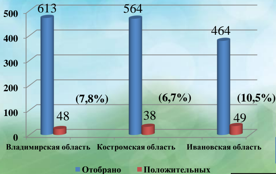
Результаты мониторинга качества и безопасности пищевой продукции на 20.12.2024 года в разбивке по регионам